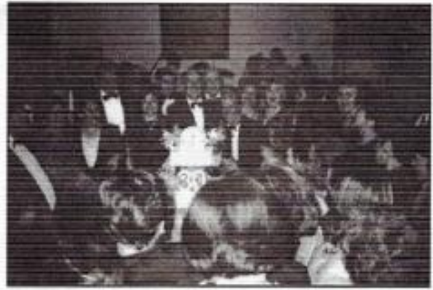
Los HH. celebrando el Aniversario de la Logia en el Templo de la Fraternidad