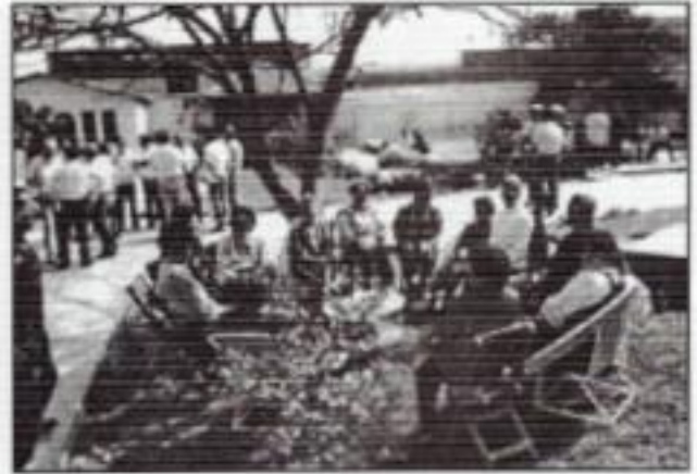
Hermanos de las Logias 71 - 92 en la casa Pimentel - Delgado.