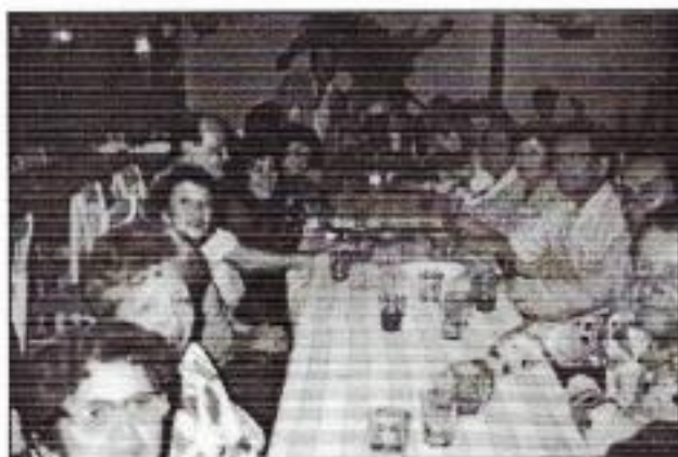
COMIDA FRATERNAL 71 - 92