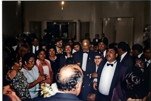
XXX Aniversario Logia Orbegoso 71 los HH.: entonando el Himno 71-92