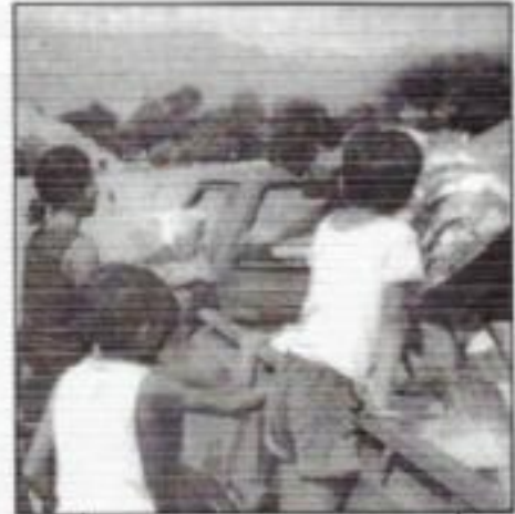
Entrega de víveres a los pobladores de Cerro Blanco.