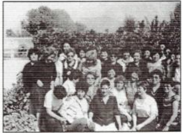
Aniversario Logia Dos de Mayo 92 reunión en Sangría las hermanas de Dos de Mayo y Luis J. Orbegoso