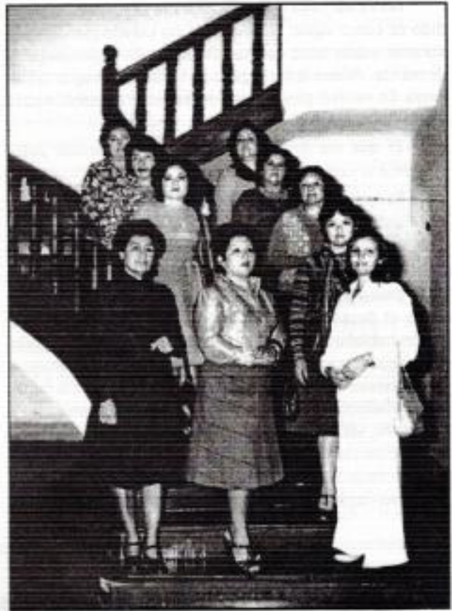
Primera Junta Directiva.

Es necesario resaltar la gran emoción social que siempre han demostrado cada una de las presidentas que continuaron, no solo el fortalecimiento de la amistad, sino de obras benéficas, tanto en el hogar de la Niña, Asilo de Ancianos y ayuda de la salud, con chequeos médicos, entregas de medicinas, reparto de víveres y últimamente ayuda a los niños para sus estudios al entregarles libros que les sirva para los inicios de su vida estudiantil, a los niños de extrema pobreza; es inmensa la labor desplegada por todas las señoras en la gestión que les ha tocado realizar, ya sea como presidente o como miembro del Comité de Damas, y a través de las fotos que presentamos trataremos de recordar la labor desplegada por el Comité de Damas, de matices muy variados, pero siempre fraternos y de amplia ayuda al prójimo.