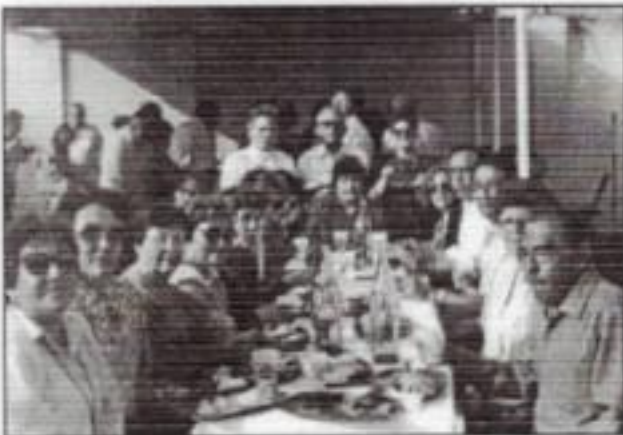
Hermanos de las Logias 71 - 92 en la casa Vereau - Alvarez.