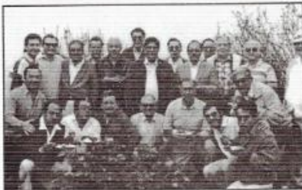
Hermanos de las Logias 71 y 92 en un almuerzo campeste en la Casa Vereau - Alvarez