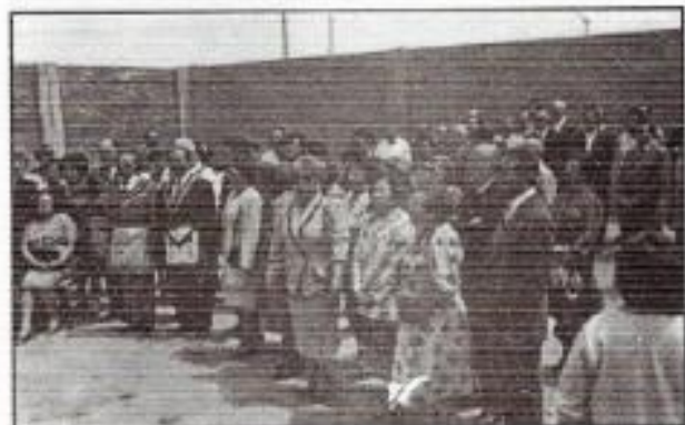
Inauguración del Consultorio Médico "San Valentín" Trujillo